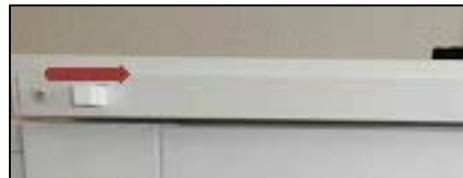
Fällda inåt, ventilen är stängd