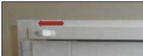
Fällda utåt, ventilen är öppen

För öppet/stängt läge skjuts knapparna i sidled. När de är fällda utåt är ventilen öppen och när de är fällda inåt är ventilen stängd. Se till att tilluftsventilen är åtminstone till hälften öppen, dvs. knapparna pekar åt samma håll.